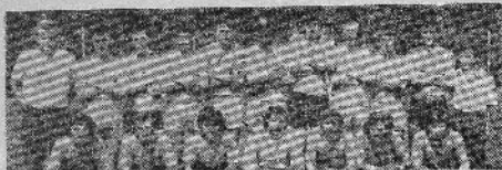
Voința JEBEL, Aufsteiger in die Fußball-Kreismeisterschaft

erworben und war durch seine Bemühungen maßgebend an dem Erfolg des Teams beteiligt.