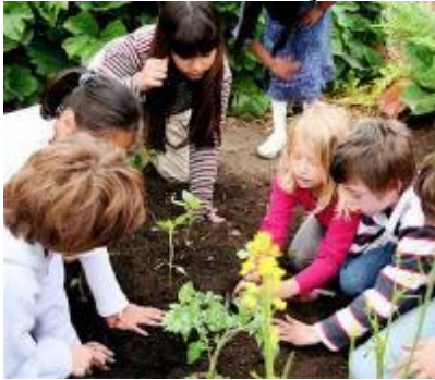
Terapie ocupațională pentru copii

Dar să vă povestesc cum am ajuns în Consiliul de Psihiatrie a Ministerului. După cum v-am relatat, Cadea devenise cunoscută în toată țara. Au venit vizitatori și din străinătate, lucru penibil, pentru că vizitarea unităților de stat era interzisă pentru străini. De fiecare dată am încercat să iau legătură cu organele mele superioare, dar parcă era un făcut, niciodată nu s-a găsit nimeni să ne dea aprobarea pentru vizită. A trebuit de fiecare dată să invităm pe cel interesat acasă la noi. Și cu cele mai fanteziste pretexte să evităm introducerea lor în spital. Îmi aduc aminte de un medic venit din Australia care nu a putut nicicum înțelege motivul pentru care nu l-am dus în unitate. Odată a apărut o rudă a dezinfecteurului nostru, care a vrut să vadă spitalul fiindcă auzise acasă la el în Suedia că există acolo o unitate care folosește tehnicile terapiei ocupaționale de la Cadea, România. Nici azi nu știu dacă a vrut numai să ne fleteze sau a spus adevărul.