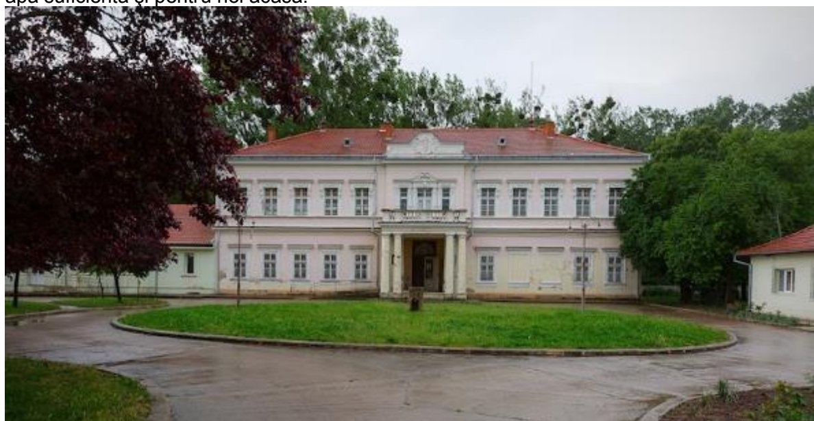
Castelul Pongrácz, Cadea

Dar cred că este timpul să descriu această unitate care apare în fața ochilor călătorului dacă trece de curba largă ce o face șoseaua națională între Diosig și Săcueni Bihor. Înainte ca Câmpia Panoniei să se sfârșească prin primele ridicături modeste de câțiva metri spre dealurile care se continuă până în Sălaj, se ridică acest castel stil rococo, de fapt un conac supraetajat la începuturile secolului XX. Cu o poartă flancată de doi stâlpi cu vase empire deasupra, cu o mică casă a portarului cu un podeț peste un firicel de apă ce curge de la capătul de sus al satului, se intra în incintă unde la dreapta era o clădire a administrației, la stânga un pâlc de brăduți, două-trei tuia de câțiva metri înălțime și trei-patru pomi care ascundeau vederii o altă clădire lungă, în