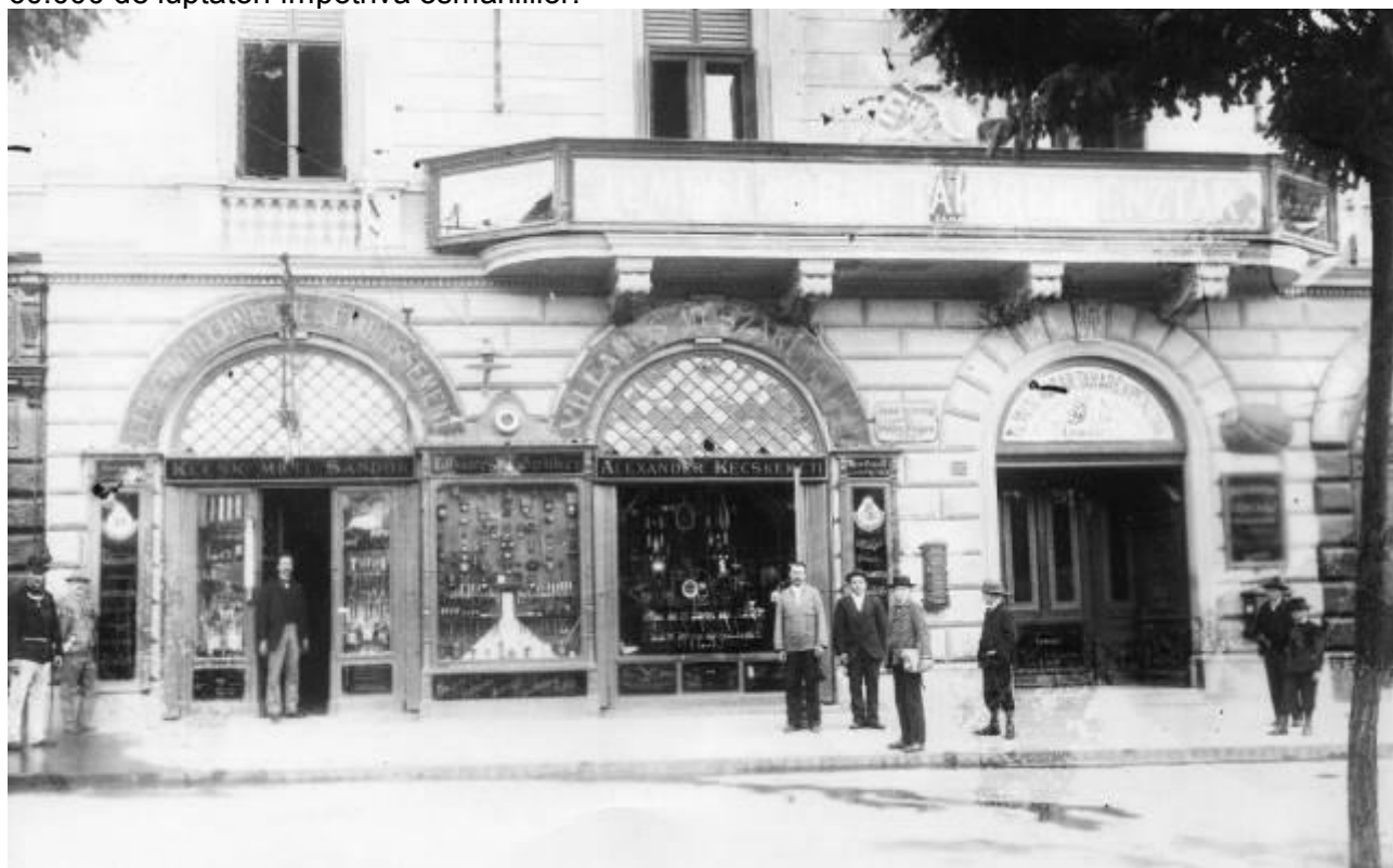
Unul din magazinele de articole optice Kecskeméti, Timișoara