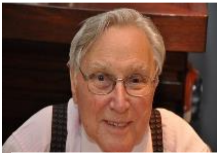
Rudi Brauch (1930 – 2014, Israel)

O relație specială am avut cu catedra de Fizică medicală. Profesorul Schorscher, un sas lung și deșirat a ținut niște cursuri frumoase, dar pentru mine confuze, din moment ce formula lui Nernst cuprindea și logaritmi. Tămâie la matematică, în timpul felceriei la Arad, apărând într-una din librării rigle de calcul rusești, pe care le puteau cumpăra doar fericiții posesori de recomandare de la locul de muncă, am cumpărat o astfel de sculă cu care puteam compune și susține statisticile cerute în rapoartele de activitate. M-am pus pe treabă, cu ajutorul cărții lui Colerus mi-am completat cunoștințele. Se pare că aceasta ambiție i-a plăcut și m-a recomandat ca meditator al unui coleg Țulu, după poreclă, care nu reușea să înțeleagă nimic din cele predate. Am ajuns astfel