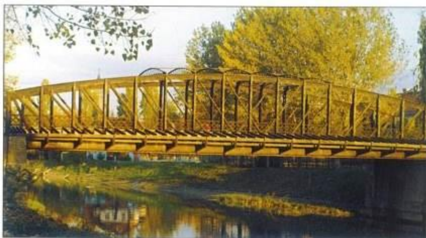
A volt Hunyadi-híd új helyén a Nap (ma Andrei Mureșeanu) és Török (ma Ady Endre) utcák között – napjainkban