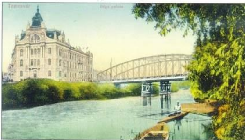
A Hunyadi-híd 1903-ban, még eredeti helyén

interesează de rentabilitatea afacerii cu taxa.