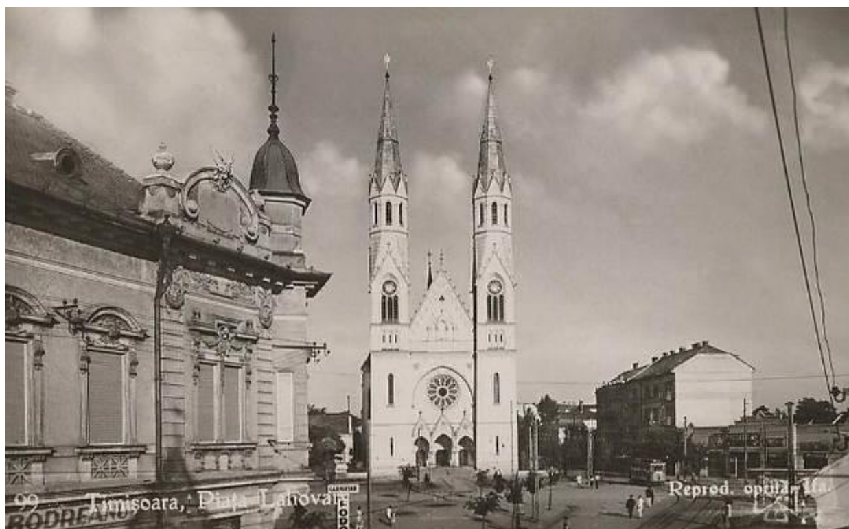
Piața Lahovary, actuala Piață Bălcescu, 1930.