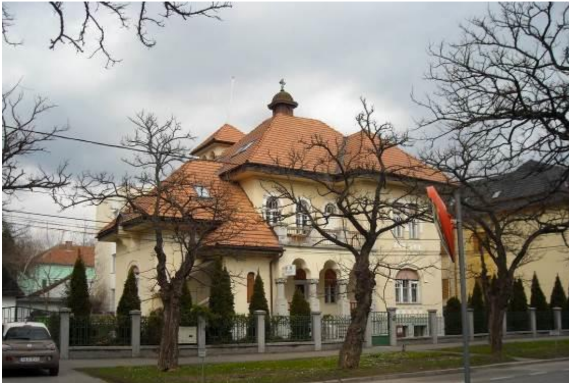
Vila Klein, acum Mitropolia Ortodoxă