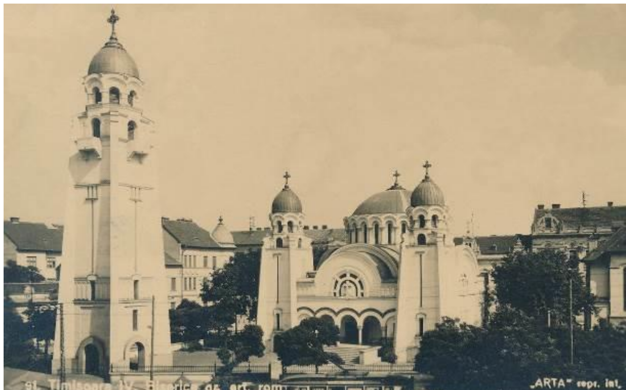
Biserica Ortodoxa (Catedrala ortodoxa veche – mica), din Piata Mocioni – Küttel, 1938. Pe malul stâng al Beghei se întinde spre sud cartierul Elisabetin având ca centru piata Lahovary devenit ulterior piața Bălcescu.