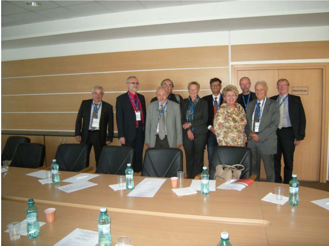
Membrii Curatoriumului Danubian de Psihiatrie