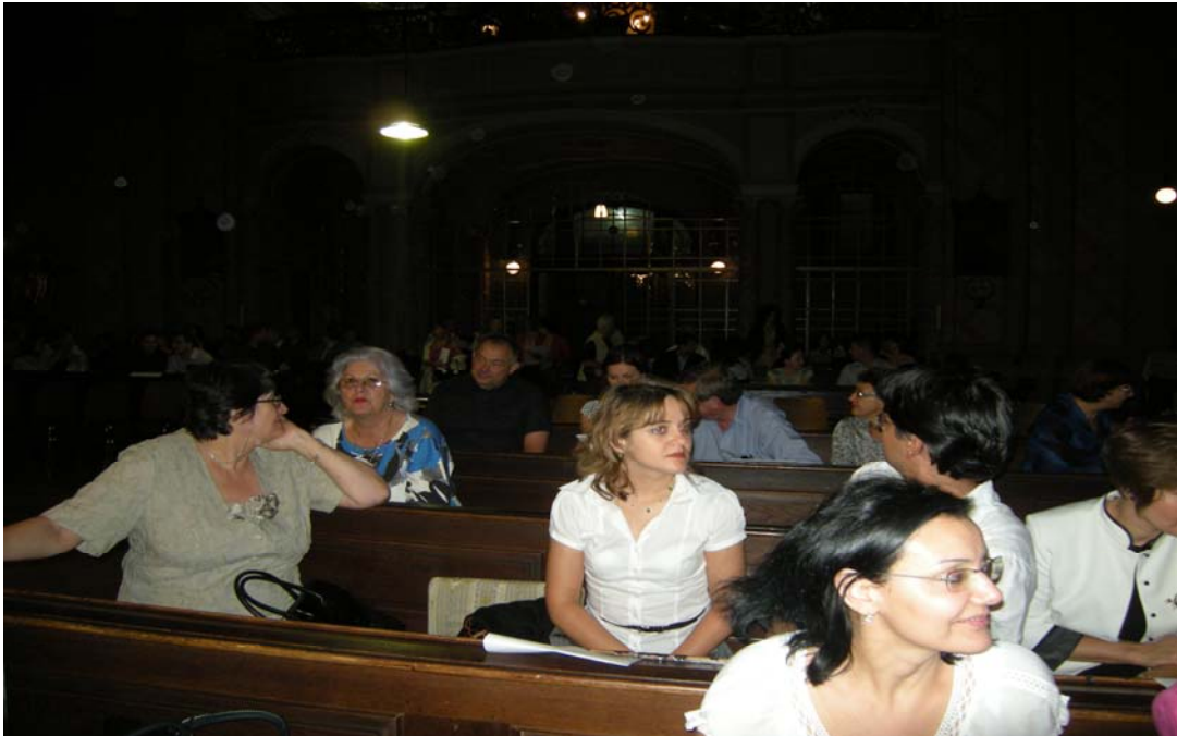
Spectacol de orgă