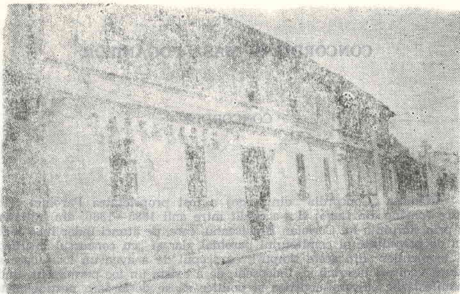
Clădirea Fundației „Alexandru și Ana Nedelcu” Str. Făgetului